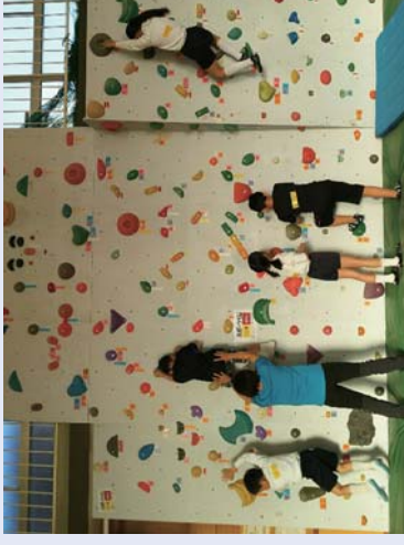
楽スポあすかによるボルダリング