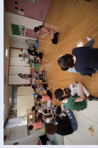
子育て支援の「らっこ教室」