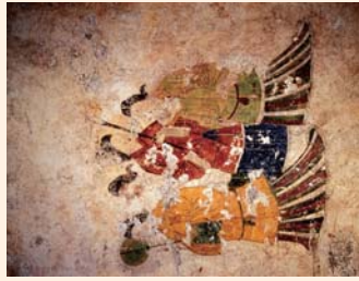
高松塚古墳「飛鳥美人」