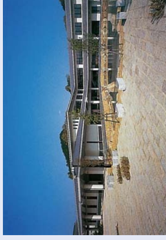
地域コミュニティの核となる「健康福祉センター」