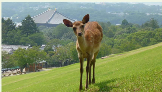
奈良公園（若草山）のシカ