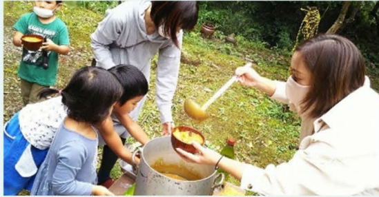
(東吉野こども食堂の活動の様子)