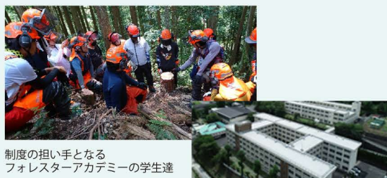
制度の担い手となる フォレスターアカデミーの学生達