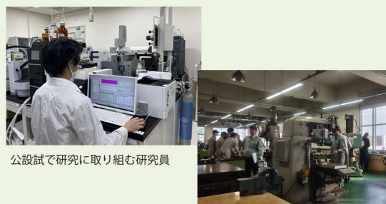
公設試で研究に取り組む研究員