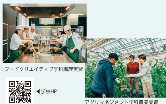
フードクリエイティブ学科調理実習