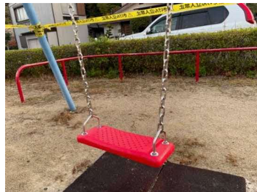
本格的な措置として座板等の交換を実施