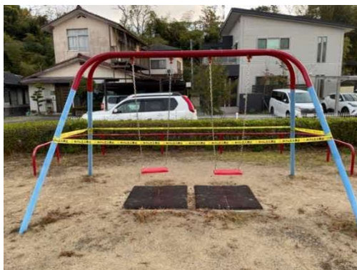
使用禁止後の本格的な措置状況