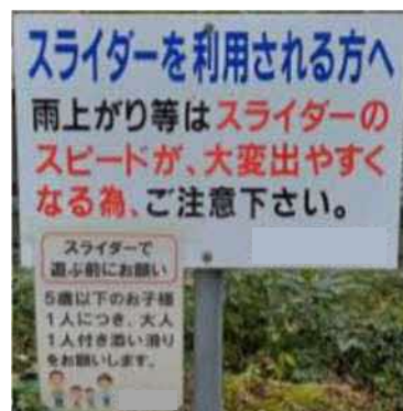
施設周辺の注意喚起状況