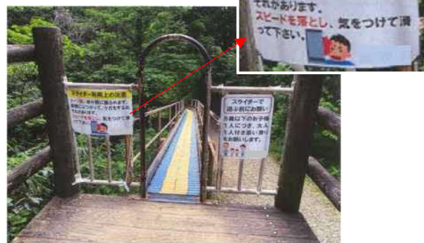
乗り口の注意喚起状況