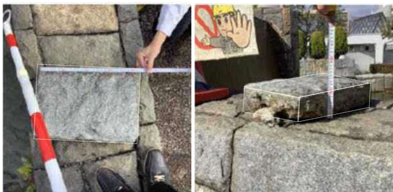
外れた修景用の石