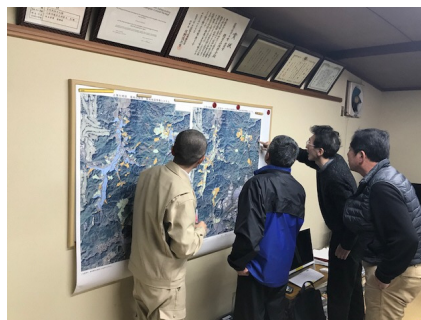
人・農地プランの話し合い

北部農林振興事務所農林普及課 担当：担い手・農地マネジメント係 石川 (農地マネジメント推進事業、特定農業振興ゾーン設定事業、地域農業担い手確保支援事業、奈良の意欲ある担い手育成支援事業)