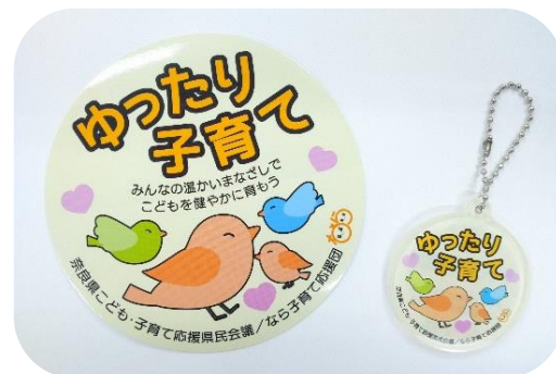
ステッカー・キーホルダー