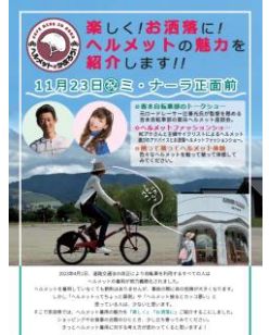
ヘルメット着用啓発チラシ 啓発イベントの開催 (R5.11)