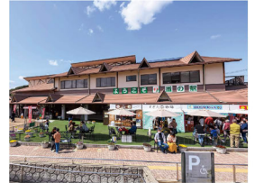
道の駅大和路へぐり 「愛と賑わいのあるふれあい広場」