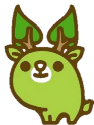
奈良県エコキャラクター な〜らちゃん