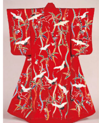
赤輪子地竹梅立涌鶴模様打掛 田中本家博物館蔵

一般 1,000円 大・高生 800円 中・小生 600円 婚礼の儀式には祈りと喜びの感情が満ちあふれています。花嫁を美しく彩る婚礼衣裳やさまざまな調度品には、幸せを祈る色や形、模様が用いられました。 このように婚礼が美しくも洗練された形で行われていた、江戸時代から昭和初期にかけての女性の婚礼衣裳や、婚礼のしつらえを紹介します。