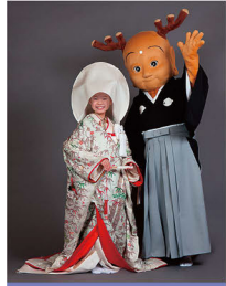
館内フォトスポットで記念写真をパチリ!