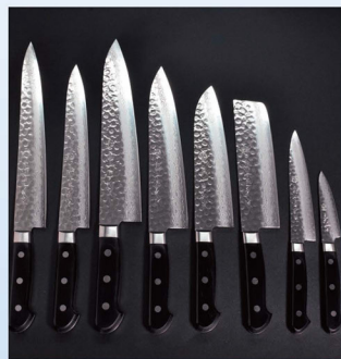
「17層ツチ目ダマスカス鋼 包丁シリーズ」

米国各地で和包丁作りの職人技を披露するなど海外に日本の伝統産業の魅力を発信。県産の日本酒や吉野杉、茶釜などの製造者とコラボレーションにより地域に貢献。