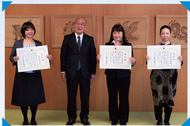
令和3年度表彰式の様子