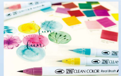
「ZIG Clean Color Real Brush(カラー筆ペン)」

奈良県の伝統産業である奈良墨に加え、書道液や筆ペン、マーカーなどを製造し80カ国以上の国々へ販売。オンラインでのプロモーション、販売にも力を入れる。