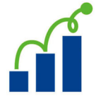
7月20日は中小企業の日

県では「中小企業魅力発信月間」および「中小企業の日」に合わせ、 中小企業・小規模事業者の魅力を広く伝えるための取り組みを推進しています。