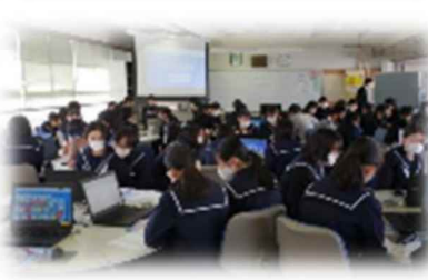
犬山中学校(愛知県)