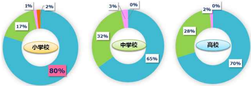
■ A1. 理解できた ■ A2. なんとなく理解できた ■ A3. よくわからなかった ■ 未回答