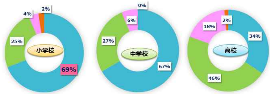
■ A1. きっかけになった ■ A2. どちらかといえばそう思う ■ A3. あまりならなかった ■ 未回答