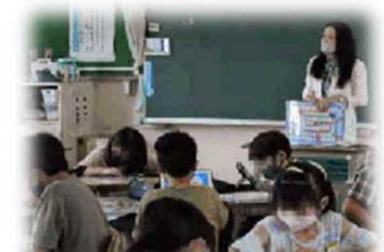
朝日小学校(愛知県)