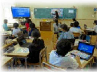
家島小学校(兵庫県)