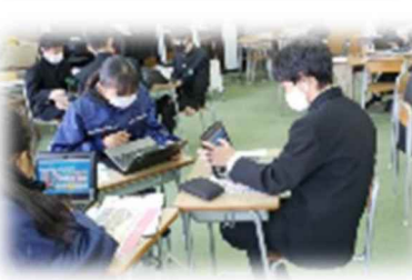
八下中学校(大阪府)