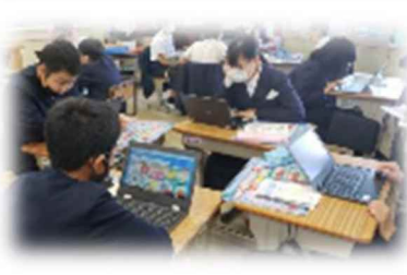
海田東小学校(広島県)