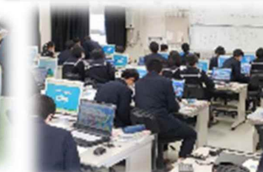
三原高等学校(広島県)