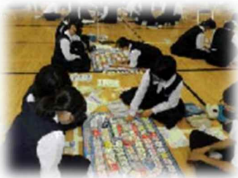
広嶺中学校(兵庫県)