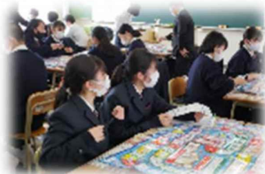
尾道商業高等学校(広島県)