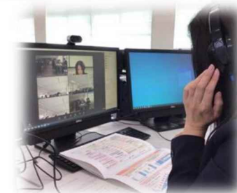
相生産業高校(兵庫県)