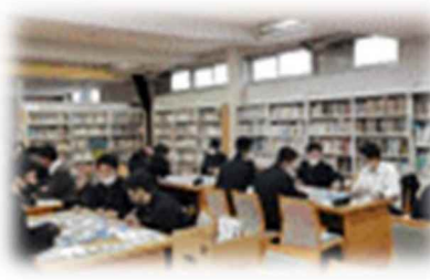
広島工業高校(広島県)