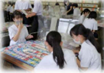
姫路高等学校(兵庫県)