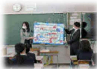
友和小学校(広島県)