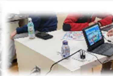
鳴滝高等学校(長崎県)