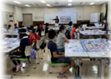
柏市夏休み教室(千葉県)