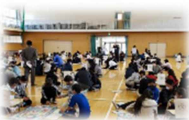
八幡小学校(兵庫県)