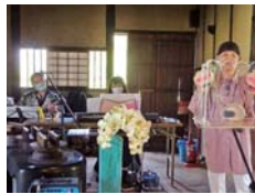
古民家活用イベント 「お話を聞いてほっこりしよう」