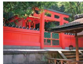
春日大社 摂社 若宮