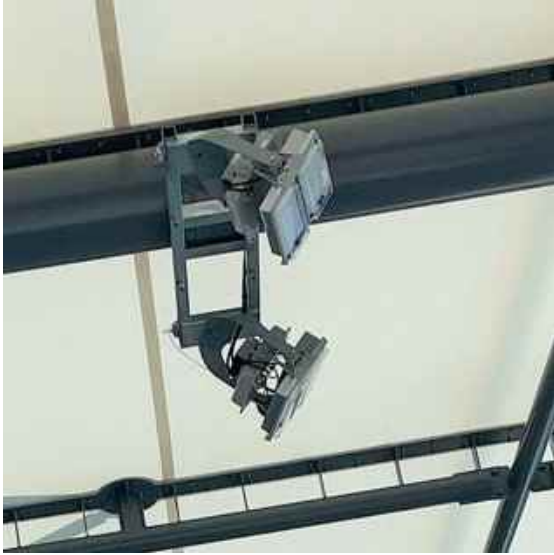
屋外プール用 照明