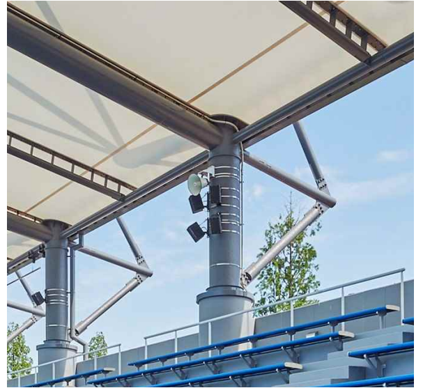
屋外プール用 スピーカー