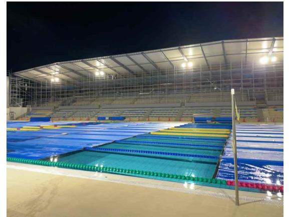
夜間利用イメージ