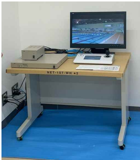
監視カメラ モニタ