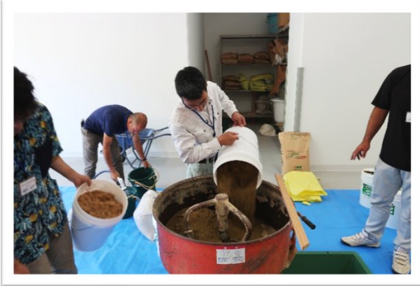
材料づくり(中塗土)