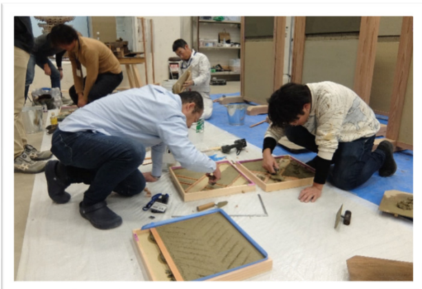
見本パネルの作成