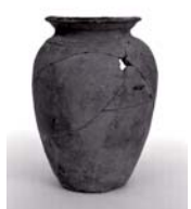
「一升一合」と書かれた須惠器蓋 平城京三条三坊五坪出土

おめでたい新年に欠かせない「宴とお酒」をテーマに、館蔵品を中心にえりすぐりの逸品を集めました。考古学を通じて、新年が明るく素晴らしいものになるよう願いを込めた展示です。