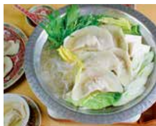
猪肉と野菜の水餃子鍋