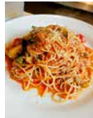
吉野鹿とお野菜のミートソース和えスパゲティ 1,700円

住所 奈良市押熊町2202-6 電話 0742-51-1256 時間 11:30~14:00 (LO) 17:30~20:30 (LO) 休み 月曜日(祝日の場合は翌日)