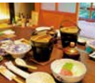
天川の味満喫御膳プラン(ぼたん鍋や鹿肉ローストなど) (1泊2食付) 13,000円~

住所 吉野郡天川村川合267 電話 0747-63-0018 時間 チェックイン15:00 チェックアウト10:00 休み 不定休