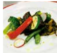
鹿肉のステーキ 2,220円

住所 大和郡山市北大工町12 電話 0743-52-2200 時間 11:00~14:00 17:00~21:00 休み 火曜日、第2月曜日