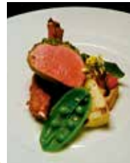
鹿肉のローストランチコース 3,520円~ ディナーコース 4,477円~

住所 橿原市北八木町1-1-8 橿原中央ビル1F 電話 0744-22-7739 時間 12:00~13:30(LO) 18:00~21:00(LO) 休み 水曜日