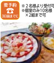
しし鍋セット(季節の前菜3種・ぼたん鍋・地野菜盛・雑炊orうどん・名物鍋餅) 7,000円

住所 奈良市高畑町1071 電話 0742-21-7530 時間 11:00~17:00 ※お時間要相談。 10名様~夕食も受付ます。 ※団体予約の状況により、一般利用の受付を一時停止または、営業時間を変更する場合があります。 休み 不定休 ※ならジビエ料理の提供は1月1日~2月28日です。