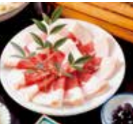
大釜猪のぼたん鍋(1泊2食付) 15,400円~

住所 吉野郡天川村洞川221 電話 0747-64-0018 時間 チェックイン14:00 チェックアウト11:00 休み 不定休