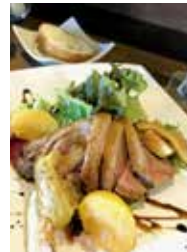
猪肉の炭火焼きロースト 1,850円

住所 橿原市新賀町208-1 1F東側 電話 0744-25-4141 時間 18:00~21:30(LO) 休み 月曜日、第3火曜日