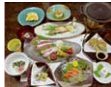
ジビエ山の幸会席(1泊2食付) 15,780円~

住所 吉野郡天川村洞川489-9 電話 0747-64-0621 時間 チェックイン15:00 チェックアウト10:00 休み 不定休