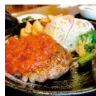
鹿肉と猪肉の合い挽きハンバーグ 1,600円

住所 吉野郡下北山村上池原282 電話 07468-5-2001 時間 11:30~20:00(LO) 休み 火曜日 ※全館休業2/6~2/10