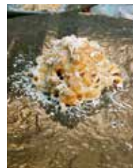
鹿肉のラグーソーススパゲティ 1,650円

住所 奈良市中町313-3 電話 0742-51-5660 時間 11:30~14:30 18:00~22:00 休み 月曜日(祝日の場合は翌日)