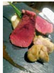
ジビエコース(鹿肉のロースト) 12,000円

住所 奈良市薬師堂町9 電話 0742-26-8959 時間 11:30~14:30 18:00~22:00 休み 水曜日