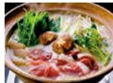
大釜しし鍋(ぼたん鍋1人鍋等を提供) (1泊2食付) 17,700円~

住所 吉野郡天川村洞川217 電話 0747-64-0878 時間 チェックイン14:00 チェックアウト11:00 休み 不定休