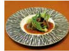
ならジビエコース(鹿肉のロースト)ランチコース5,775円 ディナーコース5,775円~

住所 橿原市雲梯町146-3 電話 0744-24-3855 時間 11:30~14:00(LO) 17:30~21:00(LO) 休み 月曜日(祝日の場合は翌日)