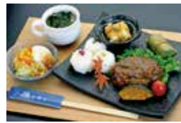
猪肉バーグセット 1,850円

住所 奈良市七条東町4-25 電話 0742-35-2300 時間 11:30~14:30(LO) 休み 月曜日(祝日の場合は翌日)