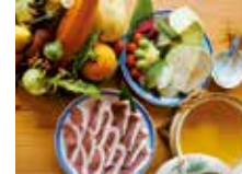
ぼたん鍋五條野菜仕立て 6,000円

住所 五條市本町2-5-17 電話 0747-23-5566 時間 11:00~14:00 17:30~20:30 休み 火曜日