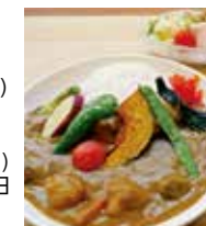
森人カレー(鹿肉カレー) 1,430円

住所 吉野郡上北山村河合552-2 電話 07468-3-0001 時間 【レストラン】11:30~14:00(LO) 【宿泊】チェックイン15:00 チェックアウト10:00 休み 【レストラン】月~金(祝日をのぞく)【宿泊】毎週水曜日、第1・3火曜日臨時休業あり