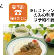
鹿肉カレー(スープ、サラダ付) 1,540円

住所 吉野郡十津川村大字平谷909-4 電話 0746-64-1111 時間 【レストラン】11:30~13:30 【宿泊】チェックイン15:00 チェックアウト10:00 休み 【レストラン】12/31, 1/1【宿泊】なし(不定休)