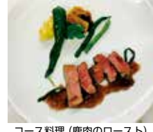
コース料理(鹿肉のロースト) 3,500円

住所 五條市二見1-9-28 電話 0747-24-2205 時間 11:30~15:00 18:00~22:00 休み 水曜日