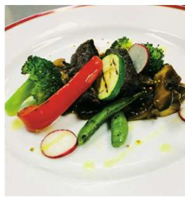
鹿肉のステーキ 2,220円

住所 大和郡山市北大工町12 電話 0743-52-2200 時間 11:00~14:00 17:00~21:00 休み 火曜日、第2月曜日