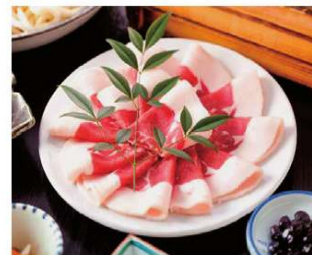
大峯猪のぼたん鍋 (1泊2食付) 15,400円~

住所 吉野郡天川村洞川221 電話 0747-64-0018 時間 チェックイン14:00 チェックアウト11:00 休み 不定休