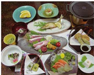
ジビエ山の幸会席 (1泊2食付) 15,780円~

住所 吉野郡天川村洞川489-9 電話 0747-64-0621 時間 チェックイン15:00 チェックアウト10:00 休み 不定休