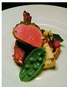
鹿肉のロースト ランチコース 3,520円~ ディナーコース 4,477円~

住所 橿原市北八木町1-1-8 橿原中央ビル1F 電話 0744-22-7739 時間 12:00~13:30(LO) 18:00~21:00(LO) 休み 水曜日