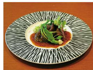
ならジビエコース (鹿肉のロースト) ランチコース5,775円 ディナーコース5,775円~