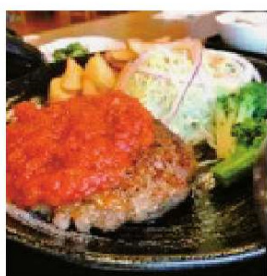
鹿肉と猪肉の 合い挽きハンバーグ 1,600円

住所 吉野郡下北山村上池原282 電話 07468-5-2001 時間 11:30~20:00 (LO) 休み 火曜日 ※全館休業2/6~2/10