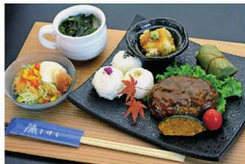
猪肉バーグセット 1,850円

住所 奈良市七条東町4-25 電話 0742-35-2300 時間 11:30~14:30(LO) 休み 月曜日 (祝日の場合は翌日)