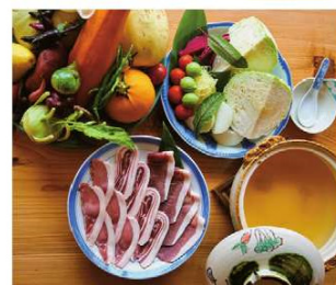
ぼたん鍋五條野菜仕立て 6,000円