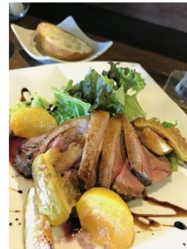
猪肉の炭火焼きロースト 1,850円

住所 橿原市新賀町208-1 1F東側 電話 0744-25-4141 時間 18:00~21:30(LO) 休み 月曜日、第3火曜日