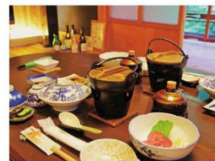
天川の味満喫御膳プラン (ぼたん鍋や鹿肉ローストなど) (1泊2食付) 13,000円~

住所 吉野郡天川村川合267 電話 0747-63-0018 時間 チェックイン15:00 チェックアウト10:00 休み 不定休