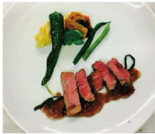
コース料理 (鹿肉のロースト) 3,500円

住所 五條市二見1-9-28 電話 0747-24-2205 時間 11:30~15:00 18:00~22:00 休み 水曜日