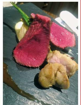
ジビエコース(鹿肉のロースト) 12,000円