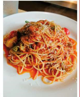
吉野鹿とお野菜の ミートソース和えスパゲティ 1,700円