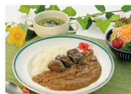
鹿肉カレー(スープ、サラダ付) 1,540円

住所 吉野郡十津川村大字平谷909-4 電話 0746-64-1111 時間 【レストラン】11:30~13:30 【宿泊】チェックイン15:00 チェックアウト10:00 休み 【レストラン】12/31, 1/1 【宿泊】なし(不定休)