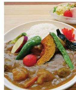
森人カレー(鹿肉カレー) 1,430円

住所 吉野郡上北山村河合552-2 電話 07468-3-0001 時間 【レストラン】11:30~14:00 (LO) 【宿泊】チェックイン15:00 チェックアウト10:00 休み 【レストラン】月~金(祝日をのぞく) 【宿泊】毎週水曜日、第1・3火曜日 臨時休業あり