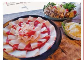
しし鍋セット (季節の前菜3種・ぼたん鍋・ 地野菜盛・雑炊 or うどん・名物 葛餅) 7,000円