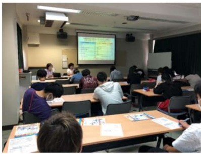
大和中央高等学校における移動講座の実施風景 (令和2年9月)