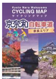
京奈和自転車道 ＜サイクリングマップ＞

○令和3年度から、京奈和自転車道を軸に、世界遺産等を周遊できる「 世界遺産周遊サイクルルート 」の案内サイン整備を推進