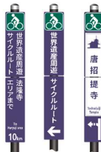
世界遺産周遊サイクルルート ＜紫色を基調としたデザイン＞