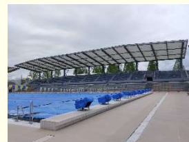
屋根つき観客席等完成状況