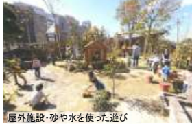
屋外施設・砂や水を使った遊び