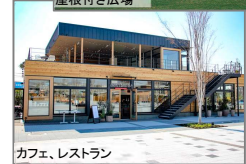
カフェ、レストラン