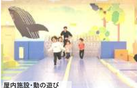
屋内施設・動の遊び