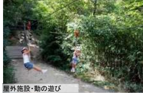
屋外施設・動の遊び