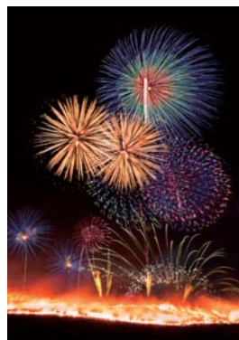
※実際の見え方と異なります

古都奈良に早春を告げる伝統行事「若草山焼き」を3年ぶりに通常開催します。春日大社の大とんどの御神火を聖火行列が若草山麓まで運び、若草山に点火します。点火直前に大花火が打ち上げられるほか、午後から若草山麓でイベントなどを実施します。