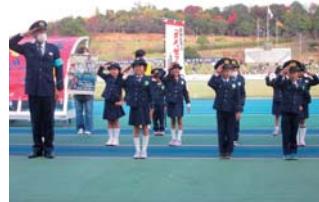
第9期生による啓発活動

時 2月26日(日)13時～15時15分 所 田原本青垣生涯学習センター(田原本町) 令和5年度に活動する「いかのおすしー人前」のダンスを通じた広報チームを結成するため、オーディションを開催します。合格者は、キッズポリスの制服を着用して、警察などが主催するイベントで被害防止の啓発を行います。 【対象】県内在住または県内の小学校や幼稚園などに在籍する4～7歳の幼児・児童 【定員】100人(応募多数の場合は抽選) 申 詳しくは下記HPまたは右記から。 問 県警察本部少年サポートセンター ☎0742-23-0110 🌐 www.pref.nara.jp/0000005558.html