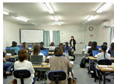
パソコン講習会の様子