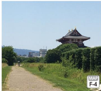
平城宮跡歴史公園 ⑤

平城京の歴史を知る「平城宮いざない館」、特産品が買える「天平みつき館」や公園の景色を眺めながら食事を楽しめる「天平うまし館」。サイクルステーション、展望デッキなどアクティビティの拠点となる「天平みはらし館」。休憩所としても利用できる「天平つどい館」という、5つの館と芝生広場、復原遣唐使船などの屋外スペースを合わせた広大な公園です。