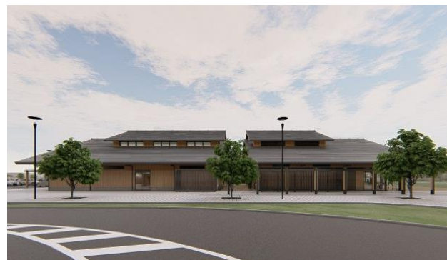
北側（敷地内道路）から建物を望む （イメージ）