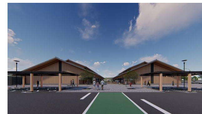
東側（駐車場）から建物を望む （イメージ）