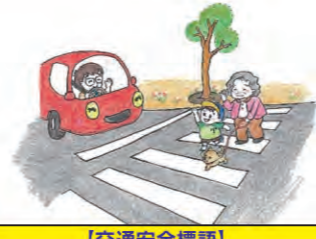
【交通安全標語】 合図して ゆずってもらって 笑顔でお礼