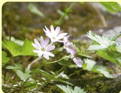
オオミネコザクラ