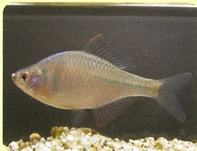
ニッポンバラタナゴ