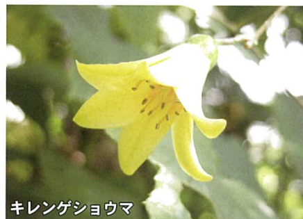
キレンゲショウマ