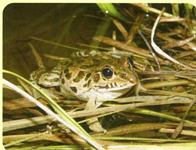
ナゴヤダルマガエル