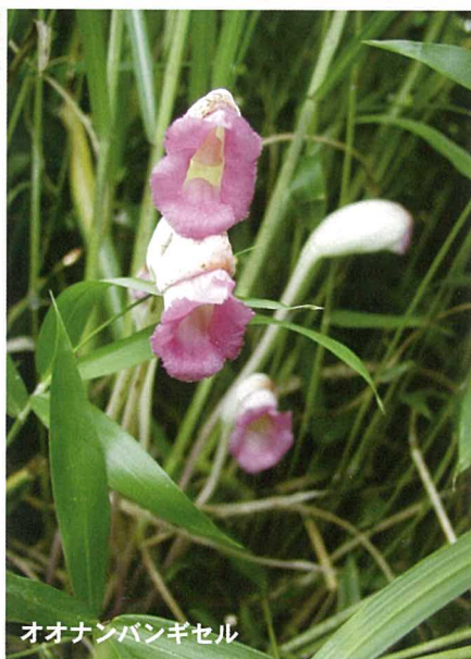
オオナンバンギセル