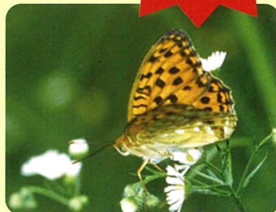
オオウラギンヒョウモン