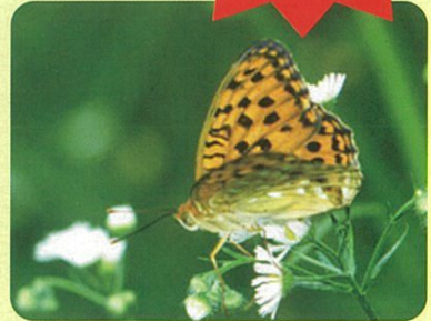
オオウラギンヒョウモン