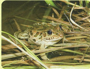
ナゴヤダルマガエル