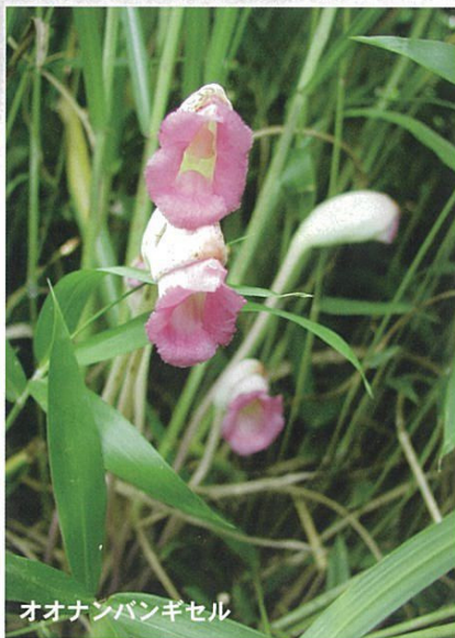
オオナンバンギセル