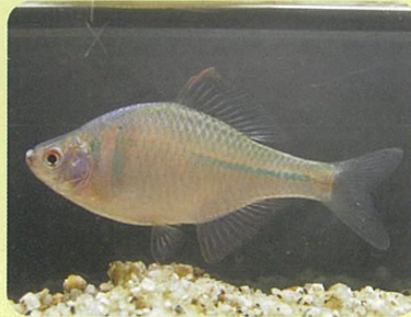
ニッポンバラタナゴ