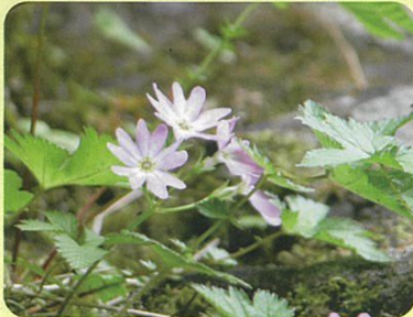
オオミネコザクラ