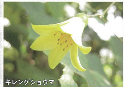
キレンゲショウマ