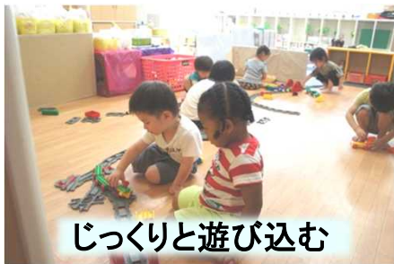
じっくりと遊び込む