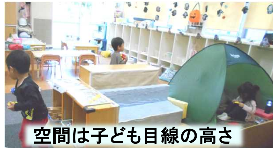
空間は子ども目線の高さ