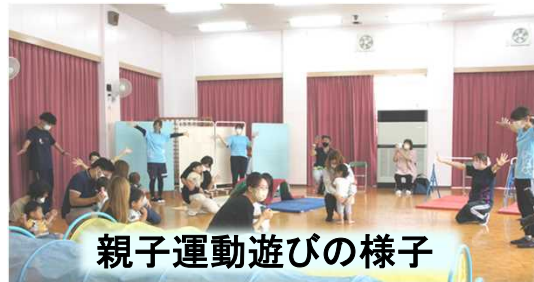
親子運動遊びの様子

安心できる環境の中、自分で選んだ好きな遊びを満足するまで遊び込むことで、他の遊びを楽しんでいる友だちに気付き、周りの友だちと一緒に遊ぶ心地よさを味わって欲しいと願う。一人一人の発達、遊びたい気持ちをしっかりと把握し、個々の遊びの思いを十分満たせる保育室の環境を整えた。また、今年度から0・1・2歳児と3・4・5歳児に運動会を分け、クラス毎にゆったりと開催することができた。そのことで、自ら遊びを選び、いきいきと活動している様子を詳しく伝え、保護者に我が子の成長を感じ取って頂けるよう、子育て啓発にもつなげている。