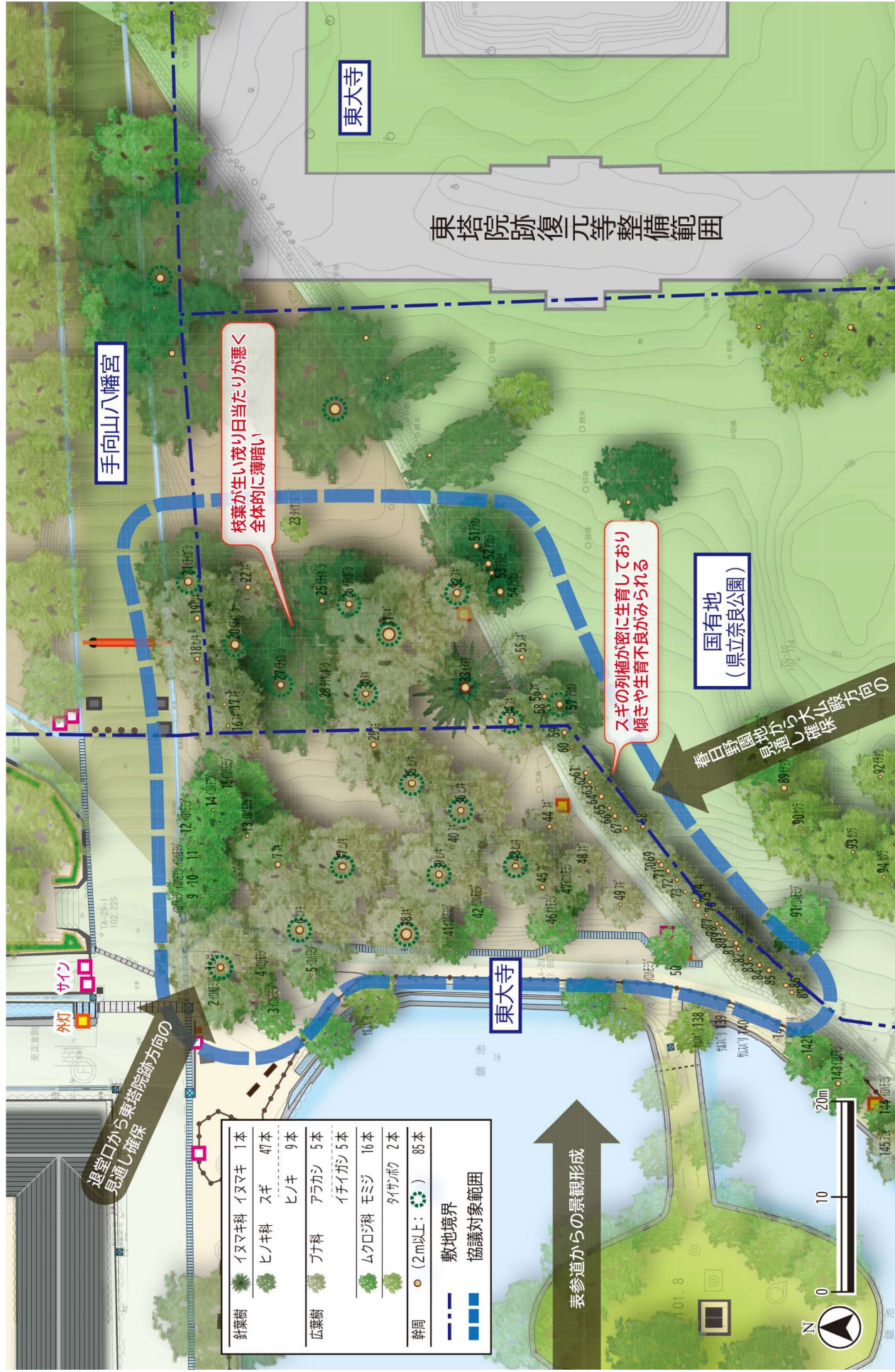
図 6-3 協議対象範囲にある樹木の現状と課題