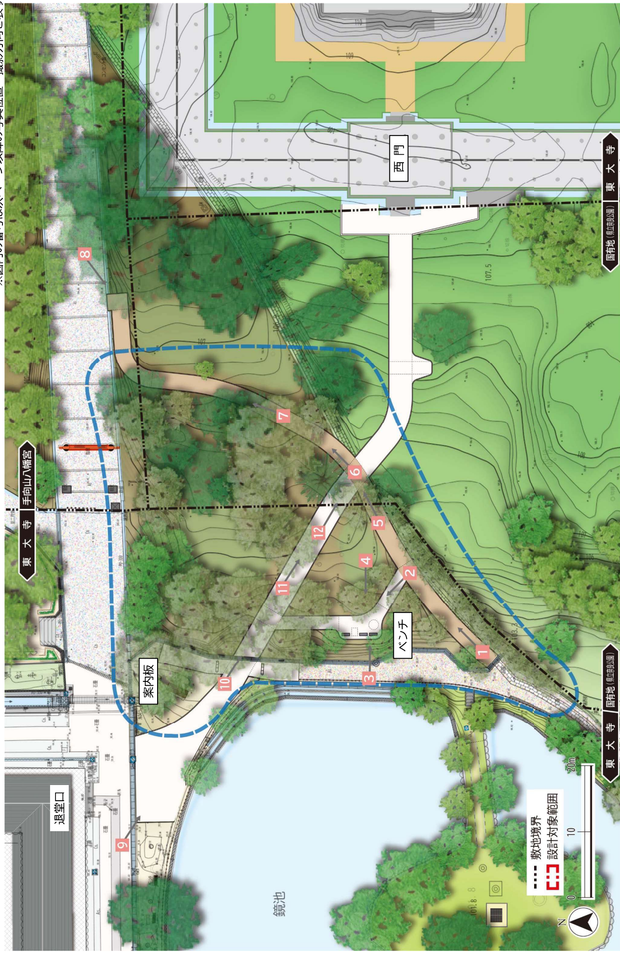
図 6-4 北西側広場整備平面図(案)