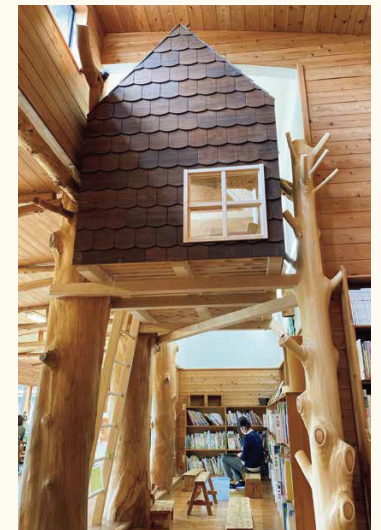
■自然の状態を生かした枝付きの磨き丸太。美しさと遊び心を備えています