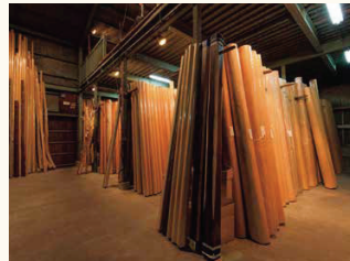
■柱づかいを中心として、様々な樹種がございます