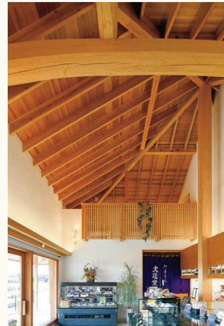
■梁や柱、格子に至るまで、杉の様々な表情を生かしています。 ※曲がり梁は現在ヒノキでの製造になります