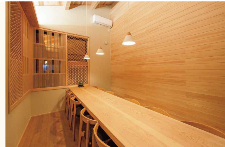
■丸太の樹齢や直径に応じて一枚板のカウンターテーブルや、壁のパネリングを製造します