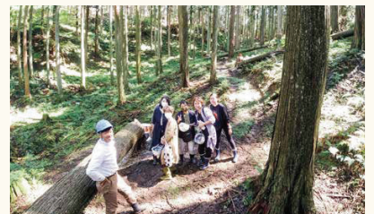
■森庄ツアーと題したツアーを通して意見交換する機会を提供させていただきます (詳細は森庄銘木Instagramをご覧ください[yamanamorisho])