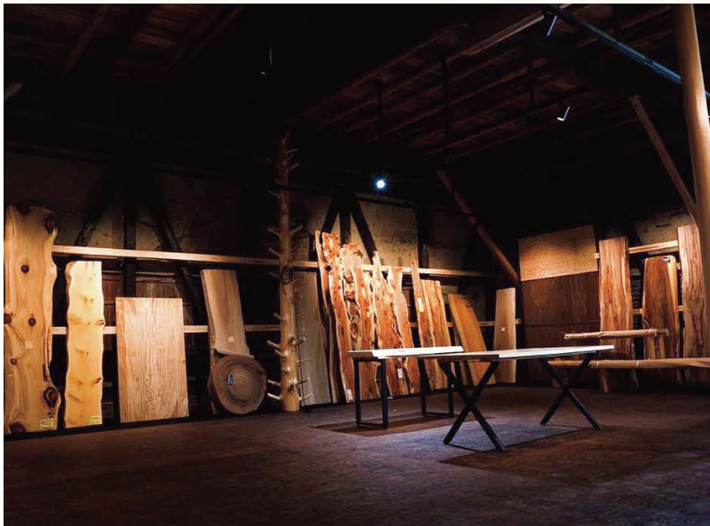
■奈良の木を中心に様々な樹種を取り扱っています

また、森庄ショールームでは、個性あふれる木々を実際に見て感じて触れていただくことができます。耐震補強を施した創業当時の土壁が残る倉庫と、新設した土壁天然乾燥倉庫。2つの空間で杉、桧の磨き丸太・シンボルツリー・杉皮・様々な樹種の板などがご覧いただけます。