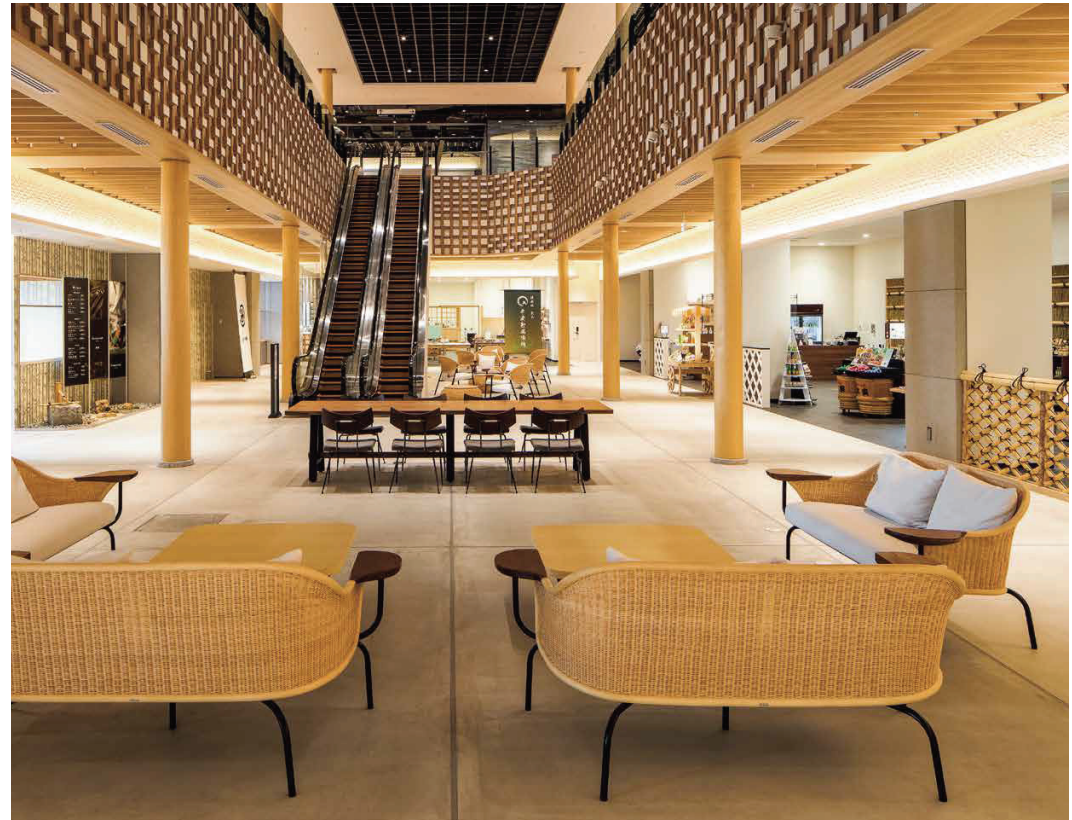
■商業施設に使用されているシンプルなシンボルツリー(杉の磨き丸太)