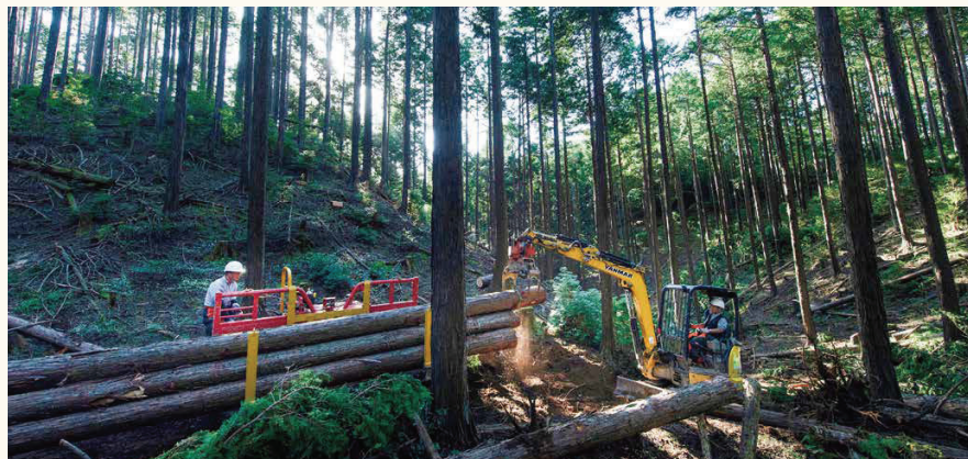
■山の中の仕事の風景です。開伐を繰り返し、持続可能な森づくりを行っています

私たちがコーディネーターとなり、企画のお手伝いから納材まで一気通貫でご提案する「一棟分まるごとパッケージ」。 林業・製材・加工・納材のすべてを見渡しながら手がけることで、森と暮らしを繋ぎます。 持続可能な森づくりのために、木材が未来にどう繋がっていくのか、設計士様、工務店様、施主様への伴走型の木材提案も可能です。