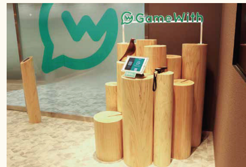
■表面の削り加工での納品事例、木目がナチュラルな雰囲気

木の表情豊かな「シンボルツリー」の製造販売をおこなっています。杉や桧、ケヤキなど様々な樹種で製造しており、つい手で触りたくなるような、滑らかな表面が特徴です。創業1927年から続く「磨き丸太」の加工技術を活用して、丁寧に仕上げています。