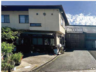
■国道166号線からの会社の全景です