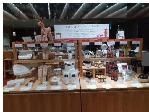
前年度実施の様子