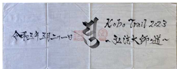
龍泉寺直筆（手ぬぐい）