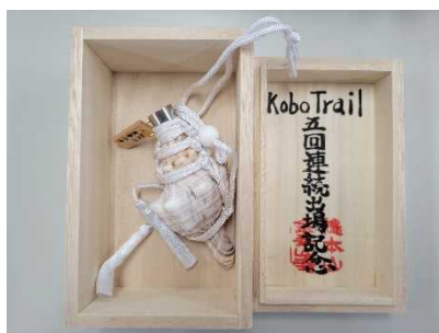
金峯山寺（ミニホラ貝）

本大会で KoboTrail 5 回参加の選手に記念としてミニホラ貝、手ぬぐいが贈呈されました。