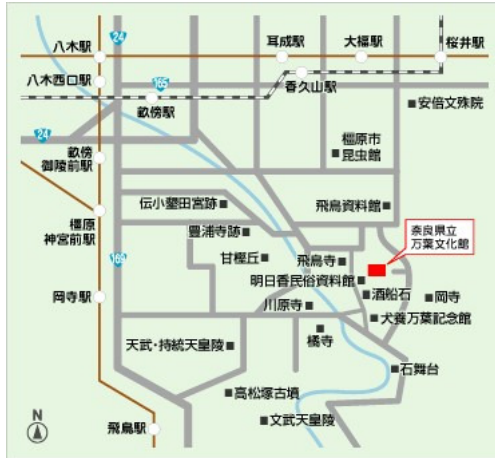
(奈良県万葉文化館HPより)