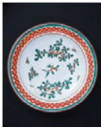
「磁器色絵スベリヒコ模様大皿」 1938(昭和13)年 当館蔵

開館記念展を飾った近代陶芸の巨匠「富本憲吉」展。開館50周年を迎え、その作品と業績を改めて振り返ります。館藏品に加え、当館では30年ぶりとなる代表作も複数お目見えします。