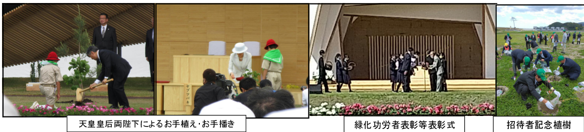
天皇皇后両陛下によるお手植え・お手播き