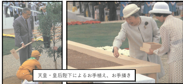
天皇・皇后陛下によるお手植え、お手播き