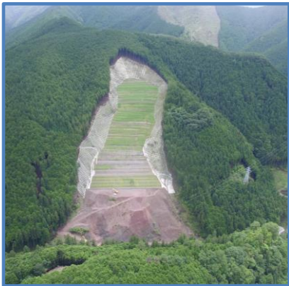
直轄治山事業 (奈良県吉野郡天川村坪内)