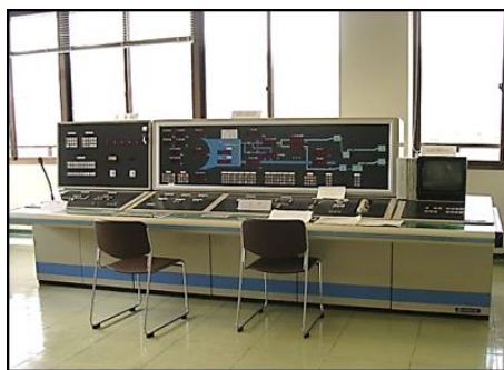
一の木ダム管理機器(五条吉野地区)