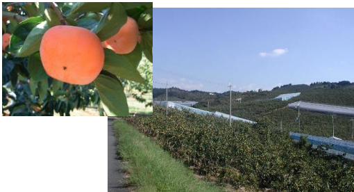
ハウス柿の栽培(五条吉野地区)