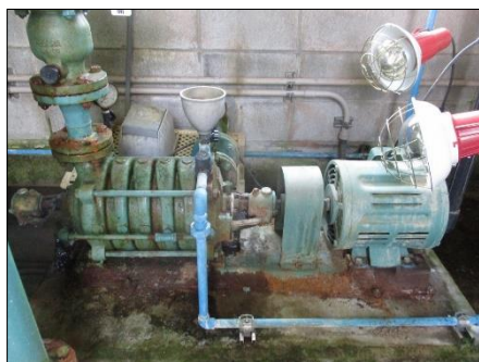
ポンプの老朽化(大和高原南部地区)