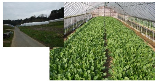
ホウレンソウ(大和高原南部地区)