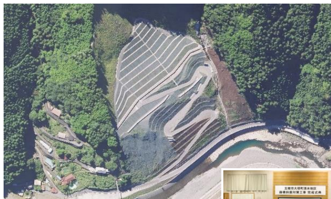
五條市大塔町清水地区の完成

五條市大塔町清水地区の 大規模斜面崩壊対策工事の完成 や、 自動化施工 を活用した 効率的な対策工事の進捗 に感謝します。