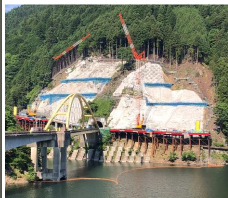
超長尺アンカーの試験削工を実施