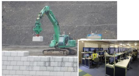
五條市大塔町赤谷の自動化施工