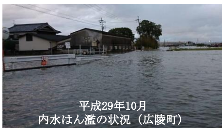
平成29年10月 内水はん濫の状況 (広陵町)