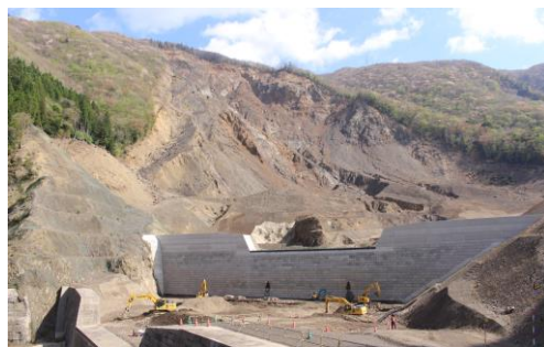
赤谷地区河道閉塞対策工事(国)

紀伊山系では、現在も不安定土砂が多数存在し、土砂により河床が継続的に上昇し、洪水氾濫の恐れ。