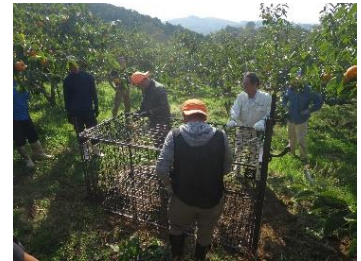
捕獲檻の設置作業