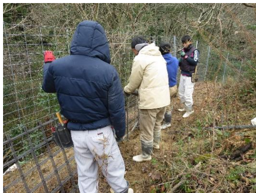
共同作業による 防護柵(ワイヤーメッシュ柵)の設置