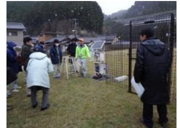
ICT捕獲檻活用研修会