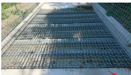
テキサスゲート シカ・イノシシの蹄が間隙に挟まるため、 圃場への侵入を防止