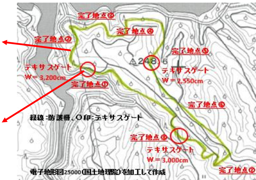
防護柵とテキサスゲートの設置箇所

ワイヤーメッシュ柵3,200m、テキサスゲート 3カ所を一体的に整備したことで、 ・ 維持管理の省力化、作業の効率化 ・ 交通の利便性確保を実現