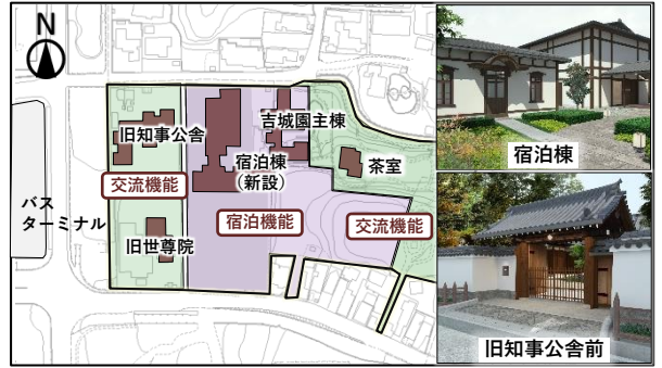
吉城園周辺地区 整備イメージ