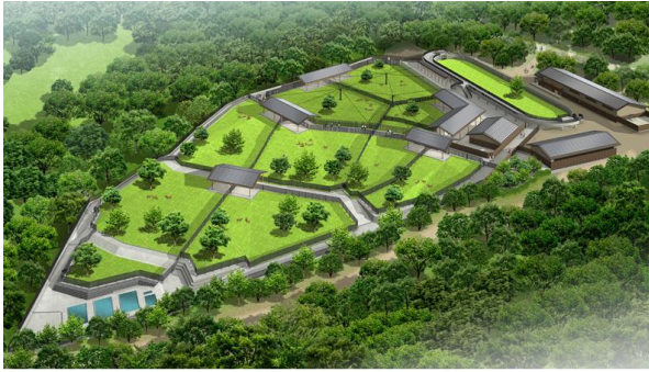
飛火野周辺地区(鹿苑)整備イメージ