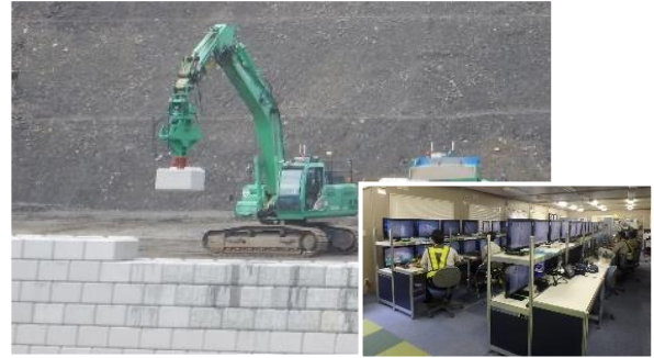
自動化施工の状況