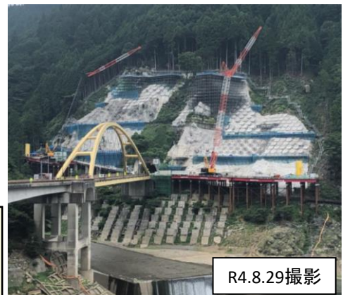
超長尺アンカーの試験削工を実施