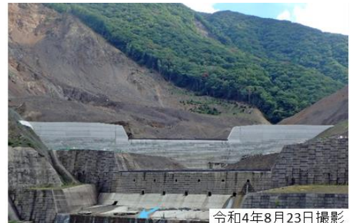
3号前堤保護工(工事中)

紀伊山系では、現在も不安定土砂が多数存在し、土砂により河床が継続的に上昇し、洪水氾濫の恐れ。