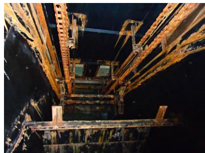
・錆による劣化が進む 自動除塵機