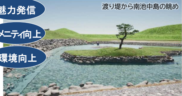
飛鳥京跡苑池(南池)復元イメージ