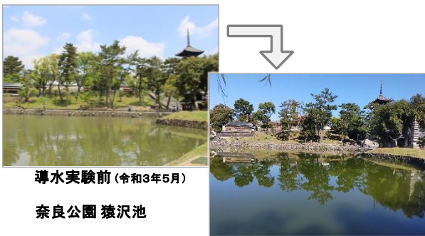
導水実験前(令和3年5月)