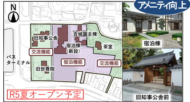
吉城園周辺地区 整備イメージ