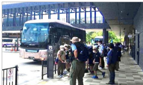
奈良公園バスターミナル