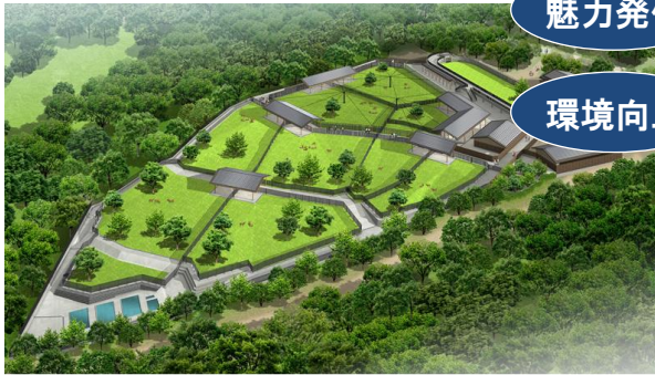
飛火野周辺地区(鹿苑)整備イメージ