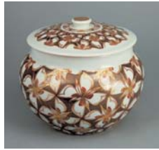
「色絵金銀彩四弁花文飾壺」 1960(昭和35)年国立工芸館蔵

開館記念展から半世紀、富本憲吉の展覧会歴をたどり、凶案家としての側面や窯業地に赴いての活動などを数十年ぶりの展示となる作品とともに紹介します。