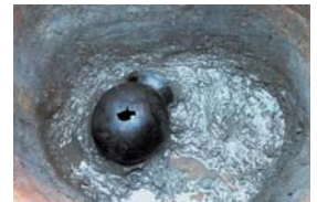
曾我遺跡 土師器甕出土状況(北から)