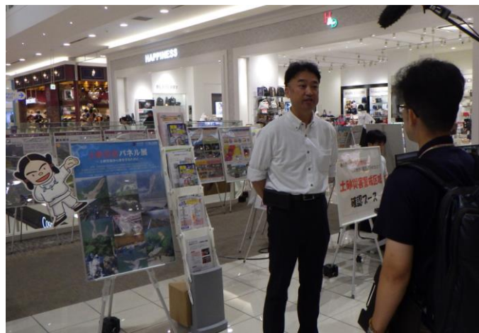
【メディアによる取材】