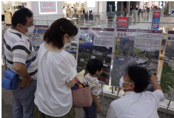
【紀伊半島大水害の概要を来場者に説明する職員】