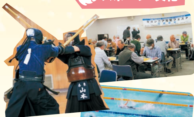
ならシニア元気フェスタ

eスポーツとは、テレビゲームなどを使って行う競技のことで、高齢者など運動が難しい方も気軽に始められます。認知機能の低下の予防にも効果が期待されており、近年注目を集めています。県内の老人クラブで体験会を実施しています。