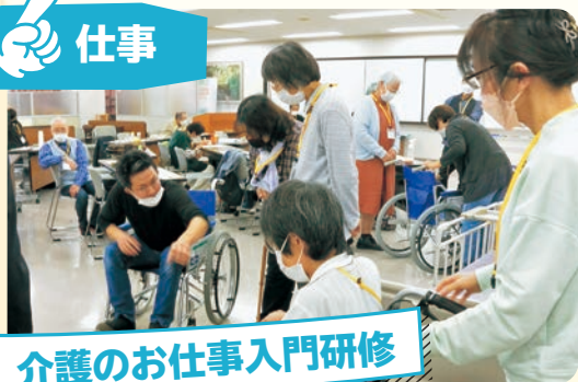
介護の仕事入門研修

介護に興味・関心がある高齢者を対象に、講義・実習を通して、介護に必要な知識と技術の習得を目指す研修です。就労を希望する方には、求人情報の紹介や面接の日程調整なども行います。研修の詳細はP19へ。