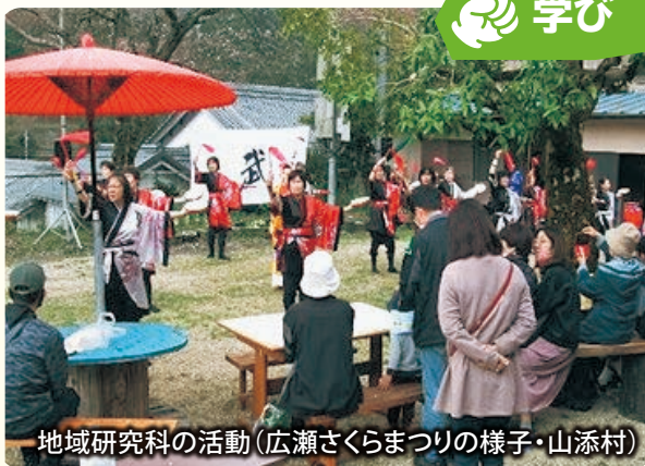
地域研究科の活動(広瀬さくらまつりの様子・山添村)