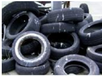
放置された古タイヤ