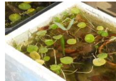
屋外の水生植物の容器