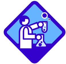
別表 補助対象経費