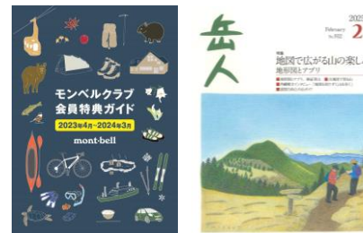
【プロモーションの展開】