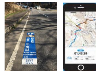
【ルート案内の充実】