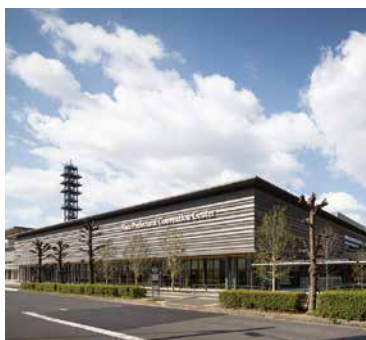
奈良県コンベンションセンター 【施設等設備運営】