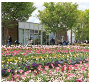
県営馬見丘陵公園 【管理業務委託】

このジャーナルの発行を通じ、公契約をめぐる状況をお伝えし、公契約条例に関わる取組が県内に広く普及し、働きやすく、就業しやすい奈良県づくりに繋がることを期待しています。