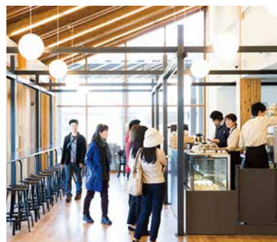
平城宮跡歴史公園(県営公園区域) 【指定管理】